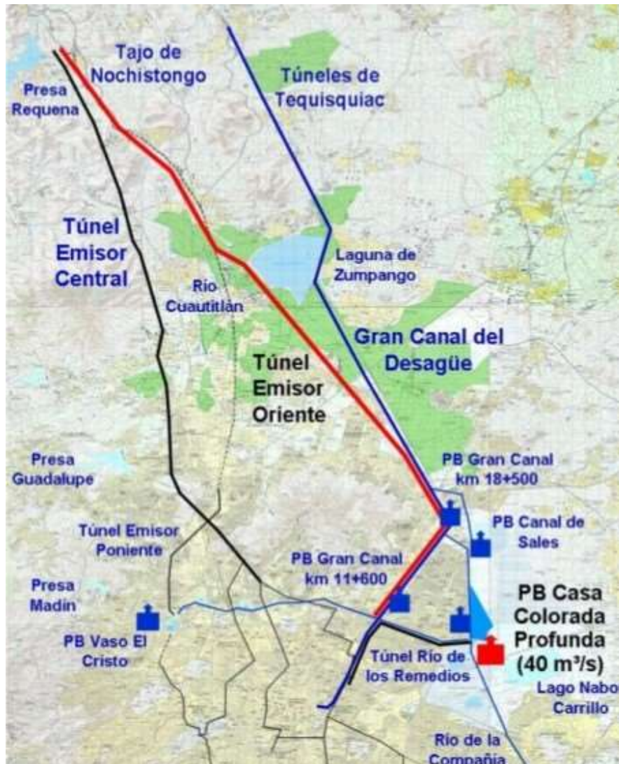
Ilustración 4 Sistema de Drenaje Profundo de la CDMX

supera los límites políticos de la ciudad, involucrando a autoridades de diferentes niveles de gobierno, no solo de la Ciudad de México.