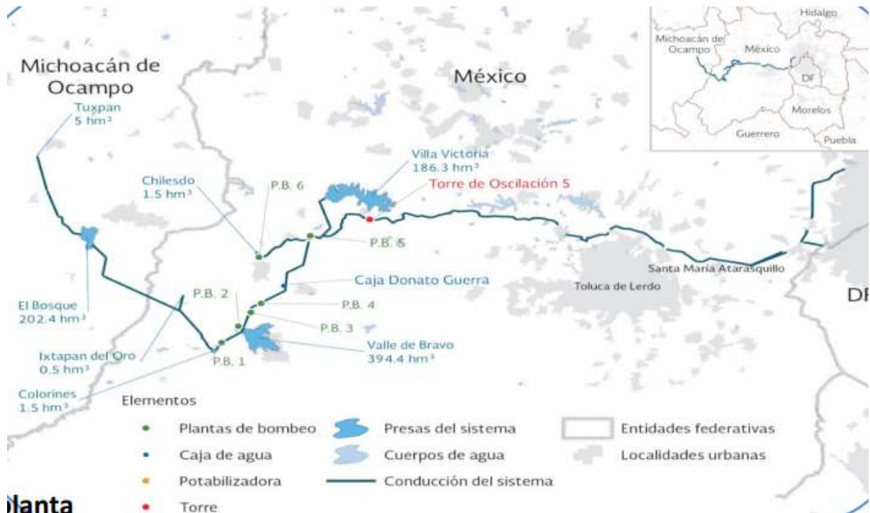
Ilustración 5 Sistema Cutzamala

Grosso modo, el Sistema Cutzamala consiste en una serie de presas que desvían agua del río Cutzamala en el Estado de Michoacán (Ilustración 3). No está de más señalar dos puntos. El primero es que, al igual que el Drenaje Profundo, funciona gracias a un importante sistema de bombas para poder enviar el agua a la Ciudad de México a una altura de 1, 100 m sobre el nivel del Cutzamala. El segundo es que se despojó del agua a la comunidad mazahua que vive en la cuenca de dicho río, expandiendo los problemas sociales de abastecimiento de agua potable de la CDMX más allá de su delimitación política.