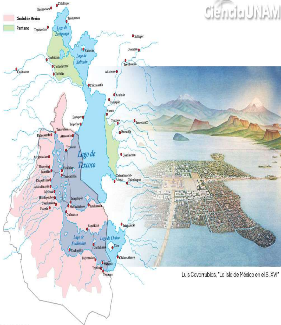
Luis Covarrubias, "La Isla de México en el S. XVI"