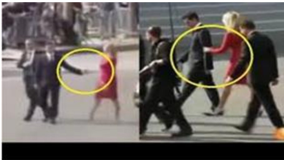
Imagen 15 Captura de pantalla, video de visita a Francia

Dos meses después de que terminara el periodo presidencial de Enrique Peña Nieto, ambos hicieron público su divorcio sin dar más detalles de las causas. Esto aunado a una serie de declaraciones de amigos y familiares, además del libro titulado “soy la dueña” de Sanjuana Martínez, donde revela que todo se trató de una estrategia, son el argumento final para confirmar lo que todos pensaban.