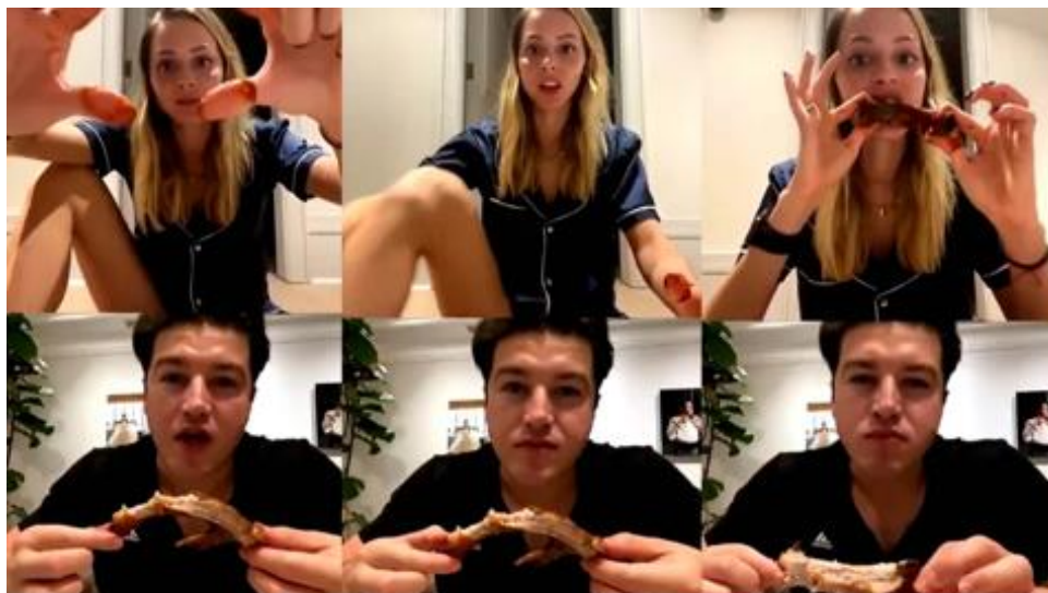
Imagen 16 Toma de captura videollamada entre Mariana Rodríguez y Samuel García

En la imagen anterior se muestran algunas imágenes obtenidas del video que protagonizaron el ahora gobernador de Nuevo León y su esposa. Tras dar positivo a un test de covid-19, Mariana Rodríguez permaneció en aislamiento, por lo que tuvo una videollamada para cenar con su esposo a la distancia. Como es usual, la influencer realizó un video en vivo de este hecho, pero no esperaba que en medio de la cena su esposo le pediría que no mostrara su pierna afirmando que él se había casado con ella solo para él no para que se mostrara, ante lo que ella solo pidió disculpas.