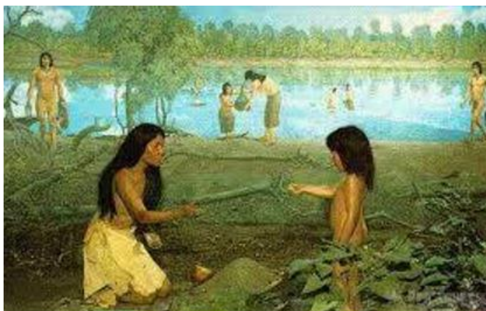
Imagen 7 Ilustración de mujer y los incios de la agricultura

A lo largo de la historia y a través de diversas culturas en todo el mundo, las mujeres han tenido por lo regular un papel secundario. Es curioso ver como los escritos con lo que nos encontramos en la red hablan del exitoso y sobresalientes que han sido las mujeres y las grandes contribuciones que han hecho para la ciencia, la cultura y para el desarrollo social; o, por otro lado, muestran a la mujer marginada, victimizada y minimizada.