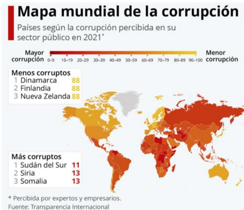
Imagen 2 Mapa de corrupción mundial

En la imagen anterior se presenta una infografía general de la percepción en cuanto a corrupción en todo el mundo. Entre los países con menos corrupción se encuentran Dinamarca, Finlandia y Nueva Zelanda; lo que no es extraño si consideramos que estos países ocupan también las primeras posiciones en cuanto a nivel educativo entre su población. En contraste se encuentran Sudán del sur, Siria y Somalia, países que se caracterizan por su nivel de pobreza y violencia generalizada.