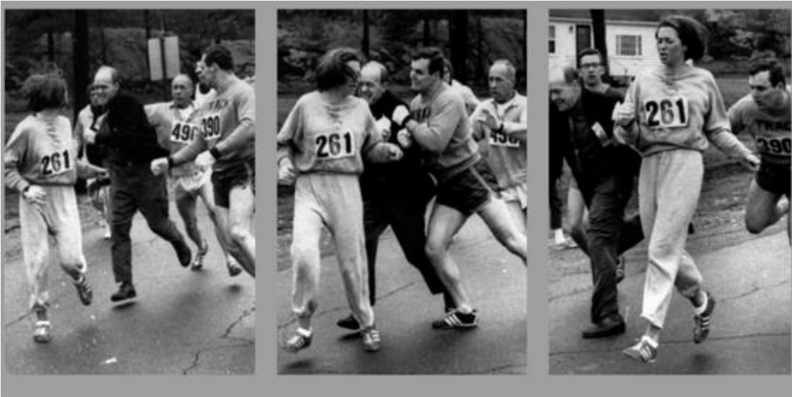
Imagen 9 Kathrin Switzer durante la maratón de Boston en 1967