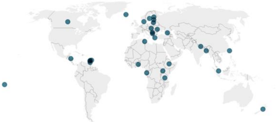
Imagen 12 Países en el mundo que tienen como presidenta a una mujer

17 presiden un gobierno 11 son jefas de Estado 3 son gobernadoras