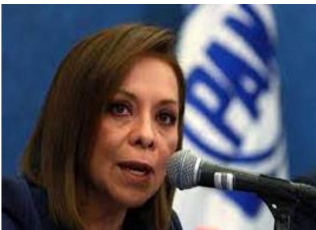
Imagen 13 Fotografía de la política Josefina Vazquez Mota