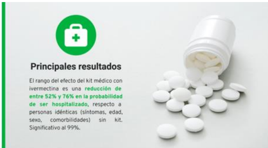
Imagen 6 Principales resultados del análisis cuasi experimental del uso de Ivermectina en pacientes con Covid 19

En dicho sitio se menciona que el método de análisis es la comparativa de hospitalizaciones y monitoreo por locatel entre personas que recibieron el kit médico y las que no.