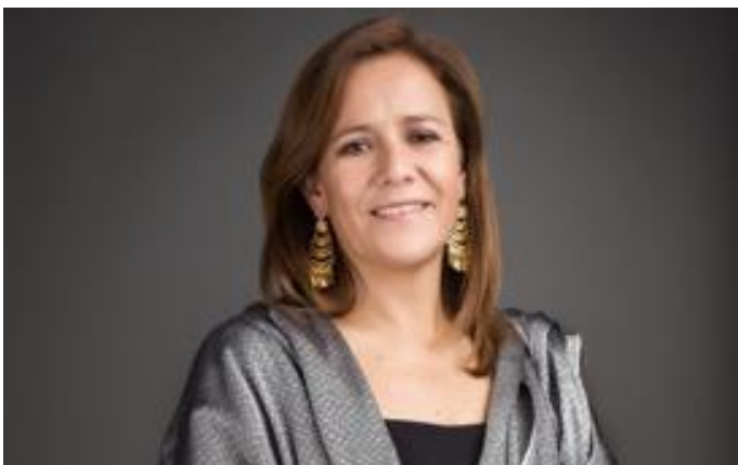
Imagen 14 Margarita Zavala