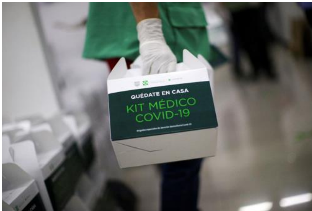
Imagen 5 Kit medico covid 19 entregado en la Ciudad de México en 2020

A finales de marzo de 2020, la Ciudad de México, a través de sus diferentes redes sociales, rueda de prensa y comunicado en su página oficial, anunciaron que se entregarían kits médicos covid-19 a enfermos y personas altamente sospechosas. 2