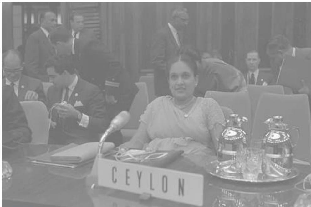
Imagen 11 Bandaranaike, en la cumbre de Belgrado de los Países No Alineados, en 1961

Se retiró a los 84 años y poco después falleció a causa de un infarto. Su hija Chandrika Kumaratunga continuó los pasos de su madre y también ha sido primera ministra de Sri Lanka.