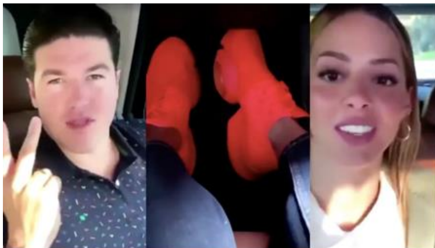
Imagen 17 Mariana Rodriguez y Samuel Garcia en polemico video

¿Por qué? Esa es justamente la pregunta, ella es la figura popular de esa pareja, cuenta con estudios profesionales, porque no postularse a la gubernatura del estado y desempeñar un papel digno como política.