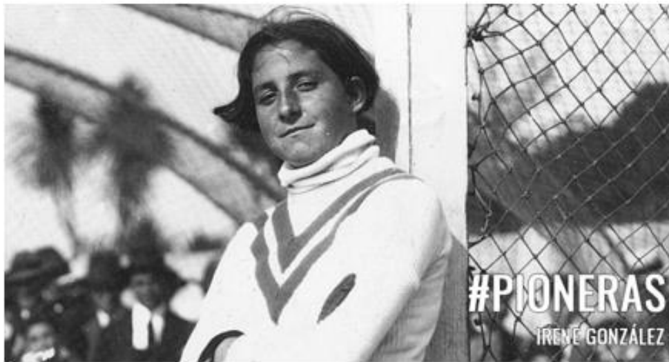
Imagen 10 Primera mujer futbolista en el mundo

Actualmente, existen selecciones alrededor de todo el mundo integrados por mujeres. Muchas de ellas continuamente alzan la voz para manifestar su desacuerdo respecto a los ingresos que perciben respecto a los de un hombre.