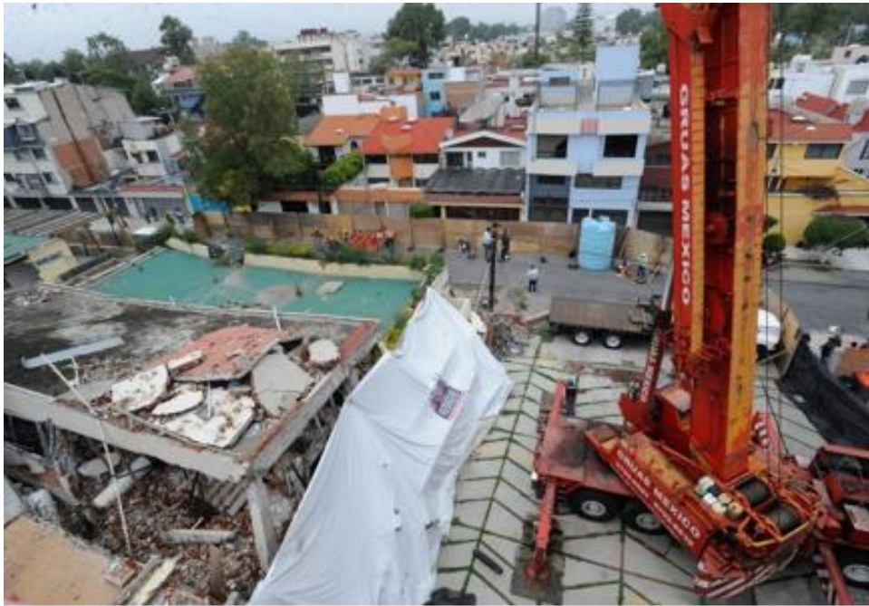
Imagen 3 Colegio Rebsamen despues del terremoto

Este hecho no le impidió a Caludia Sheinbaum ganar las elecciones a la jefatura de gobierno de la Ciudad de México en 2018.