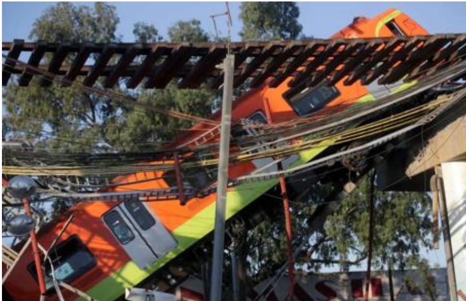
Imagen 4 Colapso de línea 12 del metro de la Ciudad de México

La pandemia por Covid-19 ha dado mucho de que hablar por todo el mundo y la Ciudad de México no es la excepción.