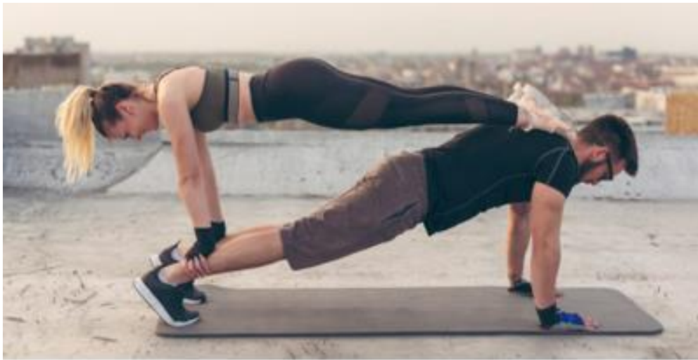
Imagen 8 Cuerpo humano femenino y masculino

Una de las razones más importantes por las que las mujeres fueron quienes permanecieron en el hogar se debe a diferencias físicas entre géneros. Las mujeres tienen la función de gestar vida en sus cuerpos a diferencia de los hombres, por lo que estos tenían que cuidar y proteger de cualquier peligro a las mujeres para lograr dar vida.