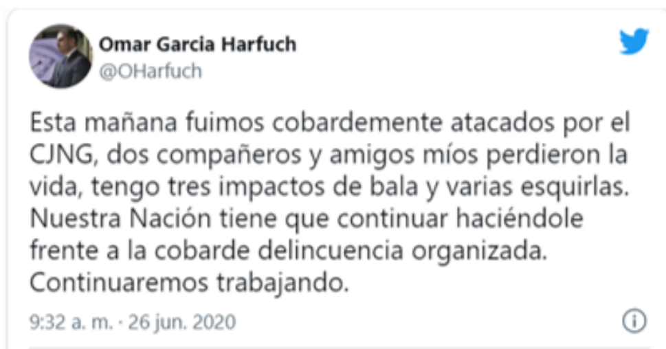
Imagen 1 Twit respecto al atentado en contra del secretario de Seguridad de la Ciudad de México

Los cargos políticos son múltiples, y aunque no todos incluyen combate a la delincuencia de forma directa, todos tienen como objetivo el desarrollo social, lo que no es necesariamente el objetivo de todos los grupos sociales del país.