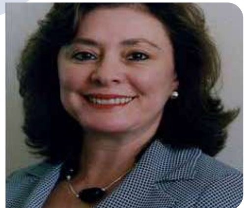
Felipe Calderón Hinojosa Secretario de Nacional del Juvenil 1987-1989

No fue así. Los humanistas más inteligentes del renacimiento concibieron al hombre en su integridad; entendieron que el hombre tenía capacidad para comprender muchas verdades y manifestaron su confianza en la capacidad humana para hacerlas vida. Dios no fue víctima del renacimiento, más bien, de los cristianos que no han cumplido con vocación.