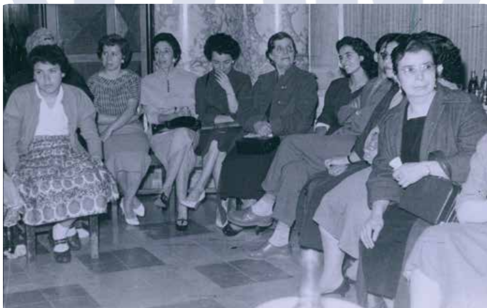
Asamblea Juvenil en Morelia de 1989

Estos jóvenes presenciaron las reformas eclesiales del Concilio Vaticano Segundo. Son los jóvenes que apostaron aún de neomarxismo , a Marcuse y Althusser y que "nunca hubo rendición", solamente represión.