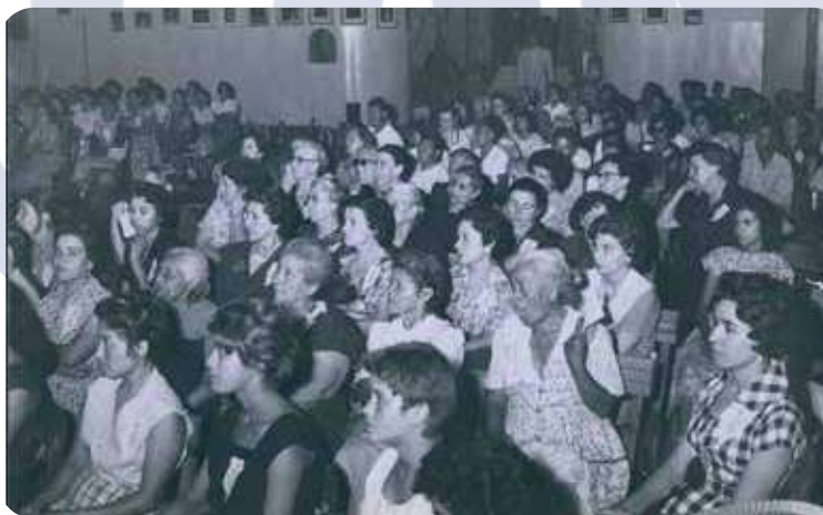
Jóvenes panistas de 1959

Y todos sabemos que, aunque nos hicieron falta en un tiempo determinado personas como él, y él mismo, estaban luchando por forjar una idea que ha sido desde siempre parte de nuestras propuestas: estaban luchando por constituir –y constituyeron con gran eficacia– asociaciones intermedias. Estaban construyendo una parte importante de la sociedad civil, tarea que nosotros mismos no podíamos echarnos a costas estando tan inmersos en la política (especialmente la electoral) y con pocas fuerzas para acometer e irrumpir en el campo de lo pre-político, que es tan necesario. De manera que cuando muchas de esas personas que parecían “generación perdida” entran o vuelven al partido en busca de su vocación política, se transforman no en “la generación que perdimos” sino en la “generación que ganamos”. Por mi parte, me congratulo de haber permanecido en el Partido el tiempo suficiente para verlos llegar llenos de energías y poder darles la más cordial bienvenida.