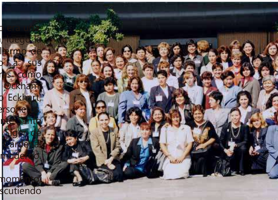
Cartel propaganda para jóvenes panistas

Evidentemente la separación, en aquella época renacentista, entre fe y razón y, sus consecuencias, no pueden ser soslayadas en la génesis de la modernidad. Ante la imposición de la fe por medio de la espada o del poder, la lucha por la libertad del hombre surge con una fuerza que antes nos había dado; así, aunado al poder difusor de la imprenta recién inventada, el socavamiento de la teocracia, tuvo lugar en la Europa occidental. Primero fue el Lutero, con la Reforma, luego Calvino y Zwinglio, cuyos seguidores serían masacrados más tarde en la matanza de hugonotes y vengados en la matanza de cristianos durante la Revolución Francesa y la Dictadura del Terror.