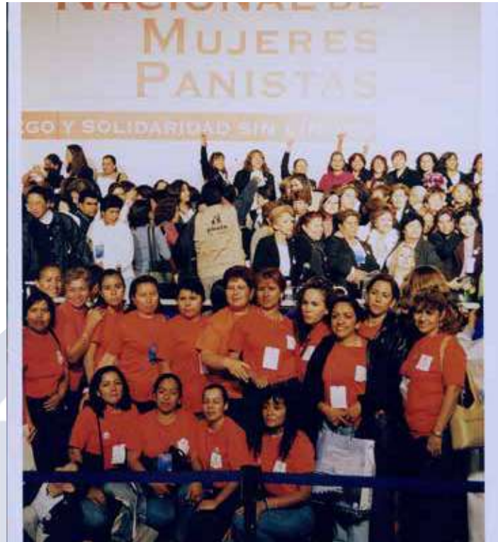
Discursos de joven panista

La llegada de la revolución industrial, la invención de la máquina de vapor y su aplicación a la producción textilera, generó una nueva clase social que no era campesina ni de comerciantes y, mucho menos, "acomodada". Irrumpe en la historia el proletariado y con ellos, "la Cuestión Obrera" y la " Cuestión Social ". Hubo varias respuestas, pero en la modernidad se presenta Carlos Marx y Federico Engels como redentores, con el Socialismo Científico o Marxismo como protesta. Ya no es la filosofía la que se pregunta sino la que transforma. Recordemos aquel famoso debate de "miserias" entre Proudhon y Marx; entre la Miseria de la Filosofía y Filosofía de la Miseria, entre los socialismos utópicos los científicos.