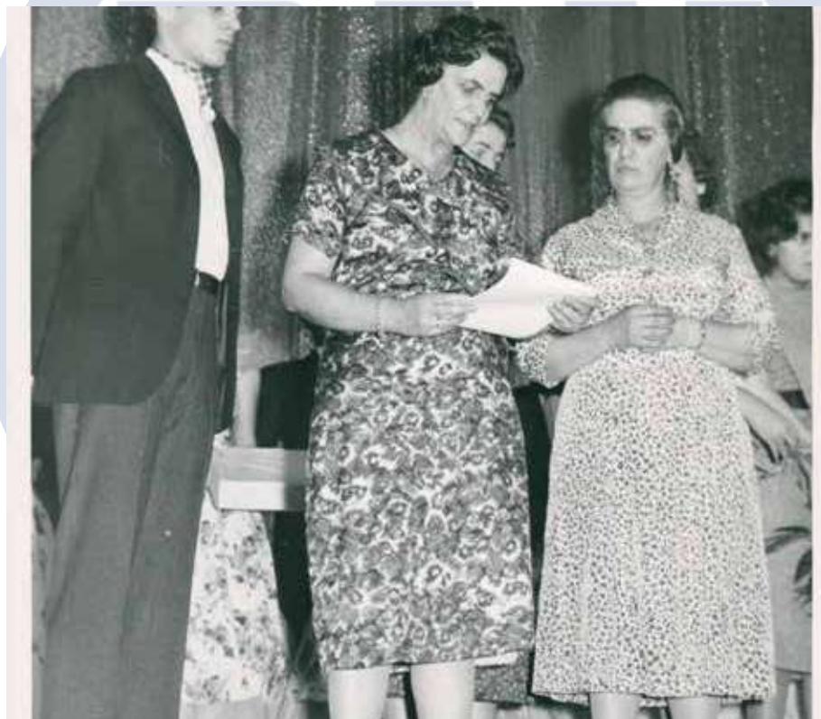
Reunión Nacional Juvenil en Guadalajara, Jalisco en enero de 1970

Este rechaza el hedonismo materialista y el materialismo desolador, los cuales son ajenos a la mente y el corazón de los pueblos, y desde el poder político tratan de imponerle a éste que silencie su fe. El humanismo es favorable a escuchar la voz del pueblo, que es la voz del buen sentido, y no a desoírlo o acallarla.