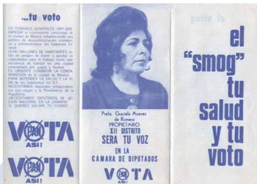
Folleto de Luis H. Álvarez Mensaje sobre la Tarea de juventud de 1958

Finalmente, durante el relevo en el mando de 1987, el Consejo opta entre las pre-candidaturas del propio Madero, de 66 años y del Sr. Luis H. Álvarez, aún mayor de 68. Y, como es sabido, por un estrecho margen, la jefatura la obtiene Luis H. Álvarez, a quien algunos analistas de dentro y de fuera del Partido, tal vez sin conocer las características personales de quien están hablando, lo califican como “viejo” para jefe de Acción Nacional.