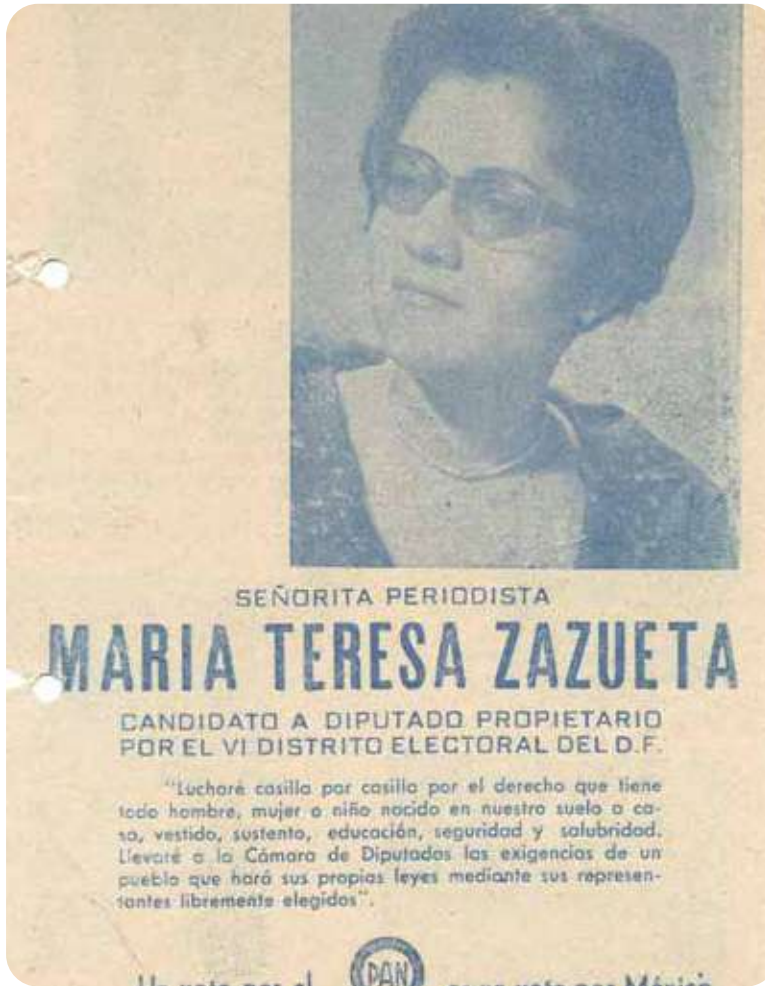
V Asamblea Nacional Juvenil del 17-19 de julio de 1998, en Querétaro

Ahora bien, ¿qué cosa es lo nuevo y qué cosa es lo viejo en el PAN? Esto es algo que intentaremos ir definiendo con los elementos que en cada momento se tengan a la disposición. Si lo "nuevo" no es la doctrina, ni la plataforma actualizada y ni siquiera algunos enfoques sobre la realidad nacional, probablemente nos acercamos a la identificación correcta si buscamos en las formas, en los modos de ser panista y de dirigir al Partido.