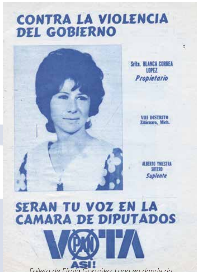
Folleto de Efraín González Luna en donde da un Mensaje a la Juventud Mexicana 1952

Solamente queda como realidad palpable, el instante. Sin ayer ni mañana. Los jóvenes posmodernos no integran un coherente de la realidad y fragmentan familias sostenimiento, amor, sexo, trabajo, dinero, esperanza, futuro, el eterno ser o no-ser.